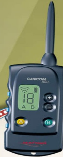
Collar Canicom 800 Valorado en 369€