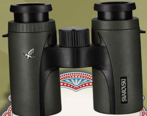
Prismáticos Swarovski Companion 10x30 Valorados en 1.050€