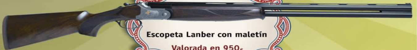
Escopeta Lanber con maletín Valorada en 950€